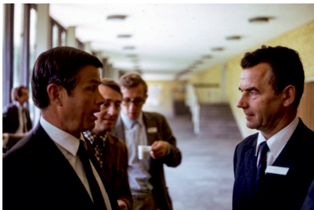
Рис. 2. Международный симпозиум по нелинейной акустике (ISNA 1969, Austin, Texas, USA). Слева — П. Вестервельт, справа — Р.В. Хохлов.

Последняя ссылка на советские работы относится к книге [8], где действительно обсуждаются эксперименты с ПА, проведенные, в частности, в Таганроге — хотя такое противопоставление “открытия и объяснения” параллельной “важной экспериментальной работе” выглядит несколько странно. Сравнительно подробное (впрочем, только на двух с небольшим страницах журнала JASA) теоретическое изложение своей идеи П. Вестервельта опубликовал в 1963 г. [4], хотя он высказывал аналогичную идею и ранее на сессии Американского Акустического общества [9] (рис. 2). Первые эксперименты в США были проведены в эти же годы [10]. С этого времени число работ, посвященных ПА, начало экспоненциально расти, и подавляющее число ссылок было на работу Вестервельта. Добавлю, что в 2009 г. мне довелось участвовать в специальной сессии Американского Акустического общества, посвященной 90-летию П. Вестервельта, в его присутствии. Я представил доклад [11], где попробовал кратко описать советскую часть истории, выделив роль В.А. Зверева и А.И. Калачева. Кажется, это несколько стимулировало интерес к их работам на Западе.